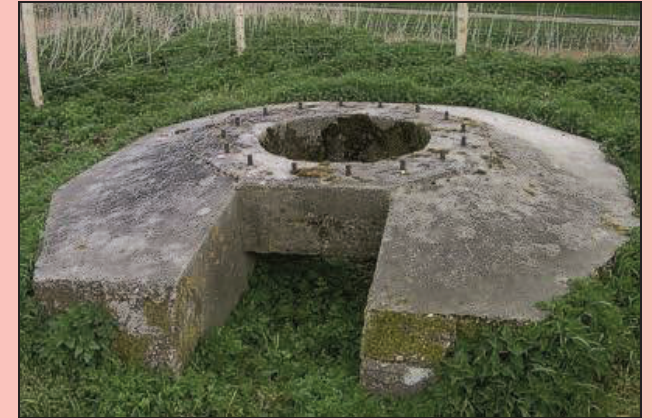
De tobroek voor de Franse tankkoepel op het fort.

Dit eeuwenoude fort vormde de overgang van het Landfront naar de kustverdediging. (Seefront) Bovenop het zogenaamde Stützpunkt Rommel ligt een betonnen fundament voor een 60 cm zoeklicht. Een tobroek had een buitgemaakte Franse tankkoepel met een klein kaliber antitankwapen en een mitrailleur. Op de zuidwestelijke punt zit een verscholen tobroek die als observatiepost diende.