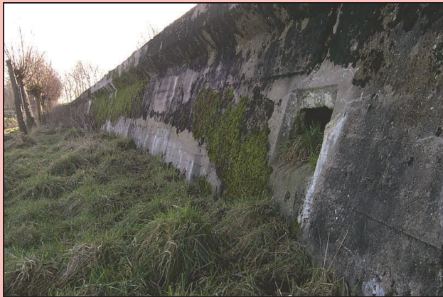
De tankmuur had enkele schietgaten voor een mitrailleur.

Vlissingen had gedurende de Tweede Wereldoorlog een belangrijke positie en werd krachtig versterkt in de Atlantikwall opgenomen. Om de stad tegen aanvallen in de rug te beschermen, werd er aan de landzijde een verdedigingslinie aangelegd. Het Landfront op oost-Walcheren bestond uit een kilometerslange tankgracht en een tankmuur.